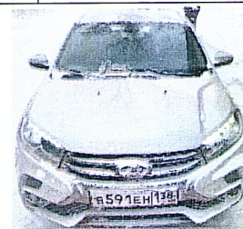
Рис.3. LADA XRAY GAB330

Учреждением оформлен страховой полис обязательного страхования гражданской ответственности в филиале акционерного общества «СОГАЗ» в г. Иркутск на автомобиль LADA XRAY GAB330 государственный регистрационный знак (далее — грз) B591EH138 – серия ТТТ № 7023006714 с 27.08.2022 года по 26.08.2023 год. Транспортное средство LADA XRAY GAB330 находится в хорошем состоянии, используется для нужд Учреждения (см. табл. 2, рис. 3).