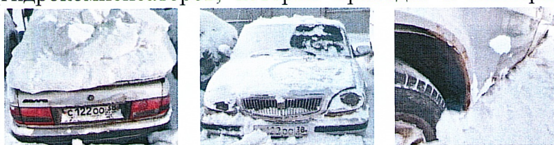
Рис. 4, ГАЗ-31105

Транспортное средство ГАЗ-31105 не используется Учреждением с 2021 года, так как находится в неудовлетворительном состоянии: неисправен двигатель (гидрокомпенсаторов, которые приводят к неисправностям систему подачи масла,