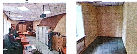
Рис.1. поз.1,2 второго этажа здания

- министерством образования Иркутской области по договору о передаче в безвозмездное пользование от 25.05.2022 - позиции 1, 2 (рис. 1) общей S=75,5 кв. м второго этажа здания, расположенного по адресу: г. Иркутск, ул. Депутатская, д. 33, сроком на один год с даты заключения договора. Передача в безвозмездное пользование согласована Собственником распоряжением от 11.05.2022 года № 51-597-мр/и;